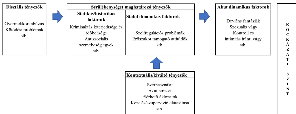
10. ábra. A magyarázóelméletek és a kockázatelemzési rendszerek összefüggései

Beech és Ward (2004) a kockázatelemzési rendszerek, illetve a szexuális bűncselekményeket magyarázó elméletek összefüggéseinek, kapcsolódási pontjainak értelmezésére egy külön magyarázómodellt alkottak meg (Beech & Ward, 2004). A modell a magyarázóelméletek és a kockázatelemzési rendszerek összefüggéseit és fogalmi megfeleltethetőségeit foglalja keretbe és illusztrálja egy áttekinthető ábra segítségével.