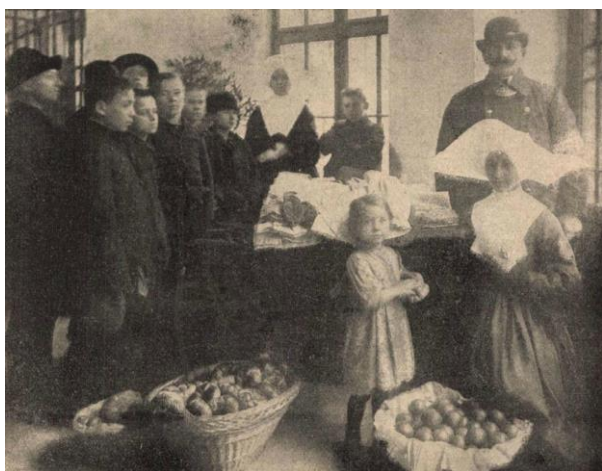
7. kép: Karácsonyi ajándékosztás a fiatal toloncoknak

Az 1908-ban életbelépett gyermekvédelmi törvényt megelőzően a fiatalkorú bűnelkövetők is itt kaptak elhelyezést, természetesen szintén külön teremben, állandó felügyelet alatt. Számuk évente általában 4-500 között mozgott. A vezetőség apácák segítségével gondoskodott taníttatásukról, vallási-erkölcsi neveltetésükről, azonban köztük is szép számmal akadtak visszaesők. 97