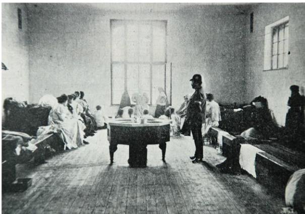
3. kép: Női fogházterem a toloncházban ( Magyar Szalon , 1898)

A fővárosban korábban csak ideiglenes, államilag bérelt toloncházak működtek. A legrégebb toloncház egy pajtaszerű épület volt a Kerepesi út végén, a Keleti pályaudvar helyén, és az 1880-as évek elejéig szolgált a toloncok elhelyezésére. Ezután a budai irgalmasok tébolydája mögött kaptak hajlékot. Az utolsó ideiglenes toloncépület a Lipót (ma Szent István) körút melletti telken állt 1885 és 1888 között. Az 1886. évi XV. tc. értelmében épült meg a Mosonyi utcai lovassági rendőrlaktanya, egyben budapesti főparancsnokság, majd egy évvel később a szomszédban végleges helyet kapó fogház és toloncház, amely 1888 nyarán kezdte meg működését. Ide egyrészt a rendőri felügyelet alá került, eltoloncolandó, budapesti illetőségüket igazolni nem tudó személyeket szállították be, de itt töltötték ki büntetésüket a különféle, jellemzően kisebb kihágások (szabálysértések) miatt elzárásra ítélt egyének is, akik gyakran csak pár órát vagy pár napot töltöttek a fogház falai között. Bár az épület hivatalos neve rendőri fogház és toloncház volt, általánosságban csak tolonháznak, tolonckörökben pedig zsúpháznak ( Schubhaus ) nevezték. 79