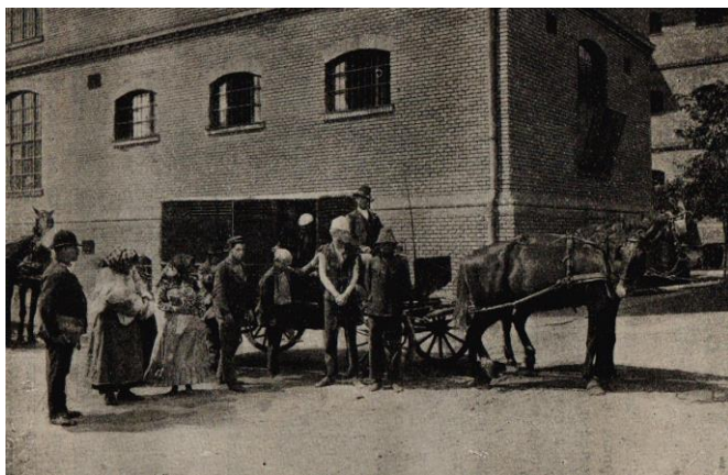
6. kép: A káposztáskocsi

A razziák után az elfogottakat először a főkapitányságra szállították, ahol döntöttek sorsukról: szabadon bocsátják őket, vagy elzárásra/eltoloncolásra kerülnek? Utóbbiakat tolonckocsin (a korabeli jassznyelven: káposztáskocsi, zöldkocsi, feketemária ill. rabomobil) szállították be a Mosonyi utcába, általában a kora délutáni órákban. Ez a zöldre festett, szellőzőrácsokkal ellátott alkalmatosság idővel az egész rendőri eljárás groteszk szimbólumává vált. Az épületbe érkezés után következett a rutineljárások sorozata: motozás, fürdetés, tisztálkodás, forró hengeres ruhafertőtlenítés és orvosi vizsgálat.