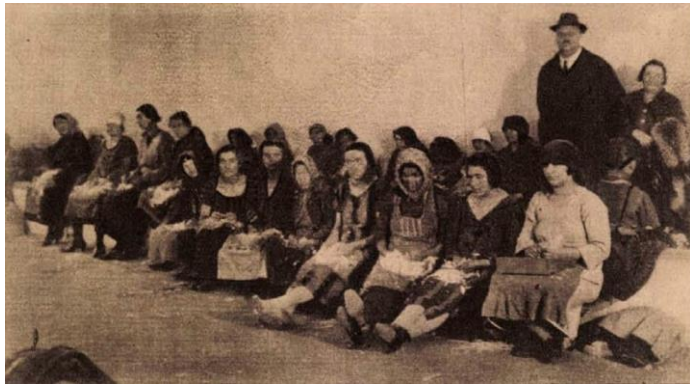
5. kép: A toloncházi nők tollat fosztanak (Tolnai Világlapja, 1925)