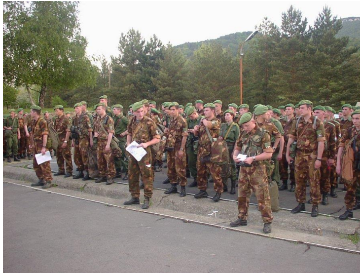
1. ábra: A Kossuth Lajos Katonai Főiskola határőr hallgatói Csobánkai kiképző bázison