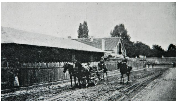
2. kép: Tolonckísérés (Magyar Szalon, 1898)

A toloncolás végrehajtási formája a hatóság elbírálása alá esett. A kényszerútlevelel történő kiutasítás csökkentette a rendőri igénybevételt, ilyenkor a kitoloncolt megérkezéséről a vidéki rendőrségnek kellett értesítenie a toloncházat. 75 Veszélyesebb, vagy többszörösen visszaeső személyek esetében a vasúton vagy gőzhajón (ezek hiányában gyalog vagy kocsin) történő tolonckíséretet alkalmazták, amely az illetőségi helyhez legközelebb eső ún. toloncállomásig tartott. Külön utasításba adták, hogy a toloncot induláskor tisztességes ruházattal kellett ellátni. 76