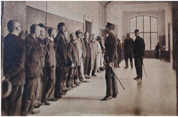
1. kép: Reggeli kihallgatás (Budapesti Hírlap Vasárnapja, 1931)

A rendelet hangsúlyozta annak preventív jellegét: „[...] a tolonczozás [...] megelőző rendészeti rendszabály, tehát még magában nem büntetés, miből foly azon szellem is, melylyel a toloncz-ügyet általában kezelni kell; az állam és a társadalom, saját vitalis biztonsági érdekeinek megvédése céljából kényszerítve van bizonyos egyéniségek irányában, s bizonyos körülmények között megelőzőleg, tehát valamely büntetendő cselekmény elkövetése előtt védekezni, s az illetőket illetőségi helyükre utasítani.” 74