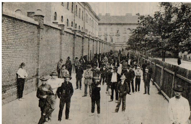
4. kép: Férfiak a toloncház udvarán (A Közbiztonság Almanachja, 1910)

egyemeletes fogházépület, ennek háta mögött pedig a tágas, kétemeletes toloncház. Az épületkomplexumot tágas, fásított udvar vette körül, amelyet minden oldalról magas kőfal határolt.